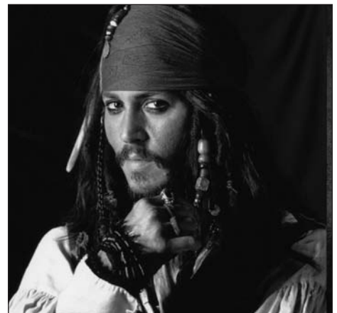
These three extremely different looks illustrate the unique way that costume designers, makeup designers, and hairstylists help actors breathe life into motion picture characterizations. Top to bottom: Johnny Depp as the title character in EDWARD SCISSORHANDS (1990), as Sam in BENNY & JOON (1993), and as Captain Jack Sparrow in PIRATES OF THE CARIBBEAN: THE CURSE OF THE BLACK PEARL (2003). EDWARD SCISSORHANDS ©20th Century Fox, BENNY & JOON ©MGM/UA, and PIRATES OF THE CARIBBEAN ©Disney Enterprises, Inc. and Jerry Bruckheimer, Inc. All Rights Reserved.